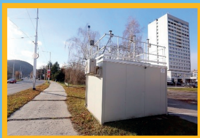
AMS, Banská Bystrica, Štefánikovo nábrežie

Na vyhodnotenie IKO nadväzujú odporúčania pre obyvateľstvo, či je potrebné obmedziť ich aktivity vo vonkajšom prostredí z dôvodu znečistenia ovzdušia.