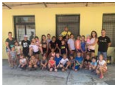
Športový deň spoločná fotografia