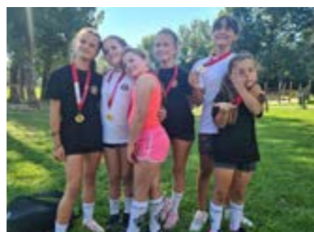
Strong race medaile