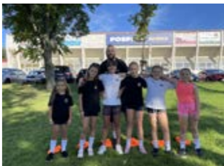
Strong race spoločná fotografia