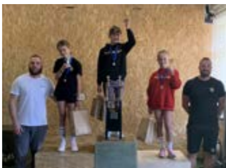
Steve cup víťazi