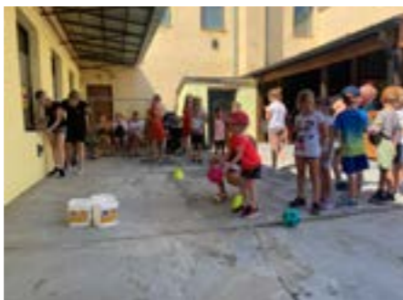
Športový deň disciplíny