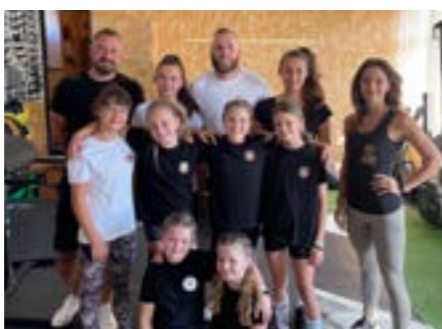
Steve cup spoločná foto